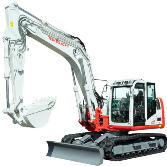
TB3150 (ブームスイング機構)